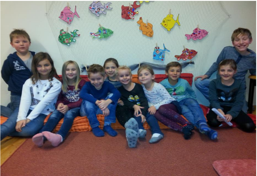
Das Foto oben zeigt die Kindergottesdienst-Kinder aus Busbach bei ihrer Weihnachtsfeier