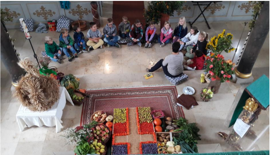
Kindergottesdienst einmal anders, an Erntedank trafen sich die Kinder in der Johannes-Kirche zu ihrem Gottesdienst inmitten der Erntedank-Gaben.