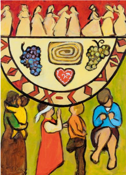
Titelbild zum Weltgebetstag 2019

Der nächste Weltgebetstag der Frauen kommt 2019 aus Slowenien